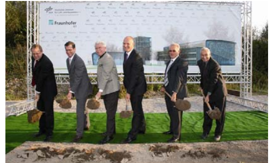
Hochkarätige „Spatenträger“ beim Spatenstich im Sciencepark Augsburg