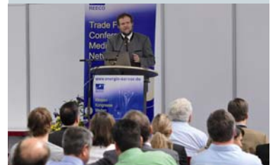
Günter Biermayer über die Perspektiven der Holznutzung für die regionale Holzbaubranche

„Holzpotenzial der Region in Gegenwart und Zukunft – Perspektiven der Holznutzung für Sägewerke, Schreiner und Zimmerer“ war das Vortragsthema von Günter Biermayer vom Bayerischen Staatsministerium für Ernährung, Landwirtschaft und Forsten im Rahmen der RENEXPO. Er referierte vor rund 50 Zuhörern über die Veränderungen des Baumbestandes in der Region und die damit einhergehenden Herausforderungen für die holzverarbeitenden Unternehmen. Durch veränderte klimatische Bedingungen wird der Fichtenbestand, der für die Holzbranche ein wichtiges Baumaterial darstellt, reduziert. „Wir müssen uns bewusst machen, dass Veränderungen eintreten. Eine Anpassung an die veränderten Rahmenbedingungen ist daher notwendig“, so der Appell von Biermayer an die Holzunternehmen.