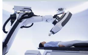
Das „Cyberknife“

Häufig ergeben sich aus industriellen Systemen Einsatzmöglichkeiten für ganz neue Bereiche. Neben den Kernkompetenzen wie der Entwicklung und Herstellung von Industrierobotern, Steuerungen oder Software beschäftigt sich KUKA Roboter seit einigen Jahren verstärkt mit potentiellen Anwendungen in der Medizintechnik und hat für die Krebstherapie eine neue Bestrahlungsapplikation entwickelt. An Stelle eines Skalpells zerstört ein robotergeführter Bestrahlungskopf mit gebündelten Strahlen präzise das Tumorgewebe. Dabei verfolgt das „Cyberknife“ jede Bewegung des Patienten millimetergenau und korrigiert die Bestrahlung. Ein Vorteil: Durch die extrem schnellen und hoch präzisen Korrekturmechanismen werden keine Kopf- und Körperbefestigungen benötigt und der Patient nicht unnötig belastet.