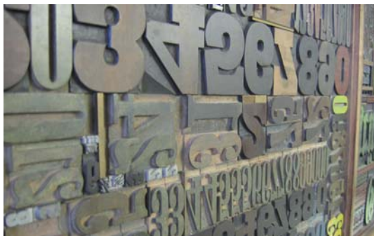
Das typoseum liefert einen Eindruck der Geschichte der Typographie und Vervielfältigung von Schriften

erste Zeilensetzmaschine und Linotype bis zum ersten Macintosh. Entwurf und Technik gehen Hand in Hand: Heute unterstützt die Agentur ihre Kunden zum Beispiel bei der automatisierten Erstellung von verkaufswirksam gestalteten Katalogen und deren automatisierte Erstellung. So spannt kaltnermedia einen Bogen von alter Tradition zu neuester Technik und schafft bei den Mitarbeitern ein Identifikationsgefühl mit dem eigenen Berufsbild. Weitere Infos unter www.kaltnermedia.de .