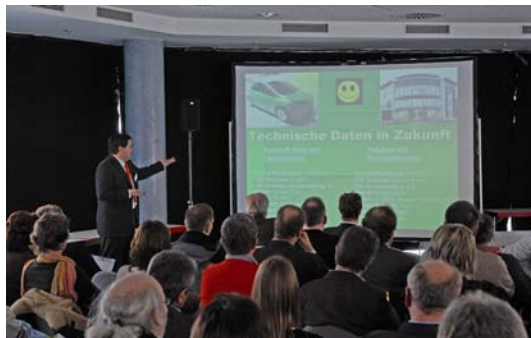
Referenten und Fachpublikum sind sich einig: Dem Baustoff Holz gehört die Zukunft

Veranstaltungsreihe „Architektur trifft Holz“ sowie dem Messeauftritt bei der RENEXPO 2009 ist das Netzwerk in diesem Jahr bereits aktiv gewesen und es entstand innerhalb relativ kurzer Zeit im Bereich Forst & Holz eines der schlagkräftigsten Netzwerke Bayerns. Es berät betriebsübergreifend Kommunen, Planer und Architekten bei allen Fragen rund um die Holzkonstruktion sowie der energetischen Gebäudemodernisierung mit Holz.