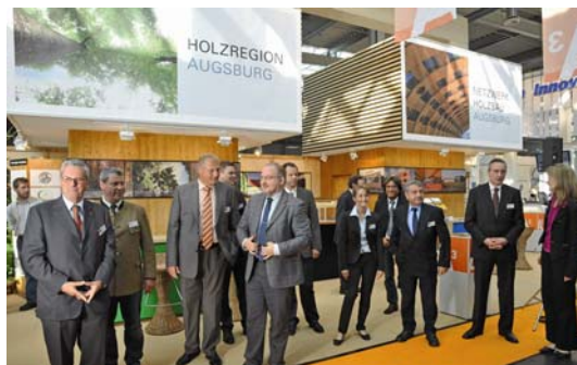
Geballte Holz- und Forstkompetenz aus A 3 auf der RENEXPO 2009

kamen rund 20 geladene Bürgermeister aus dem Wirtschaftsraum Augsburg am A 3 -Stand zusammen, um sich ebenfalls ein Bild von der Holzbaukompetenz am Standort zu verschaffen.