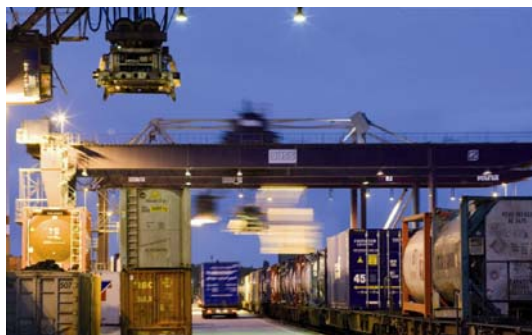
So geschäftig könnte es auch bald im GVZ Augsburg zugehen

den bundesdeutschen als auch den bayerischen Durchschnitt. Im Vergleich mit anderen Wirtschaftsräumen hat die Logistikbeschäftigung seit 2005 überproportional zugenommen, sich besser entwickelt als die Gesamtbeschäftigung. Potenzial für den Logistikstandort Augsburg bietet vor allem der hohe Anteil produzierenden Gewerbes, das eine stetige Nachfrage für Logistik-Dienstleistungen generiert: Weltmarktführer und Global Player wie MAN Diesel, Fujitsu Technology Solutions oder UPM Kymmene wickeln vom Standort Augsburg aus ihre globale Logistik ab. Von der Werks- über die Versand- bis zur Servicelogistik sind für sie die unterschiedlichsten Belieferungswege wichtig. Insbesondere für produktionsorientierte Logistikfunktionen ist der Standort damit hoch attraktiv. Die Lage innerhalb der kaufkräftigsten