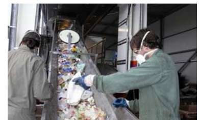
Abfall ist Wertstoff - mit der mobilen Abfallsortieranlage des LfU wird der Restmüll der Kommunen unter die Lupe genommen.