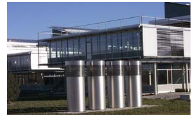
Hightech-Arbeiten hinter moderner Fassade: Am LfU in Augsburg arbeiten 450 Fachleute im Dienst von Bayerns Umwelt.

Vor genau zehn Jahren hat das LfU in der Fuggerstadt seine Arbeit aufgenommen und ist zum Markenzeichen und wichtigen Partner in der Region geworden. Nun gibt es Erfreuliches zu vermelden: Im Frühjahr dieses Jahres hat der Haushaltsausschuss grünes Licht für den Erweiterungsbau am Standort Augsburg gegeben. Ab dem Frühjahr 2010 rücken die Bagger an. Der Neubau soll 16 Millionen Euro kosten und im Frühjahr 2012 fertig gestellt sein. Dann wird die gesamte Umweltanalytik am Standort Augsburg gebündelt und 70 neue Arbeitsplätze werden in Augsburg entstehen.