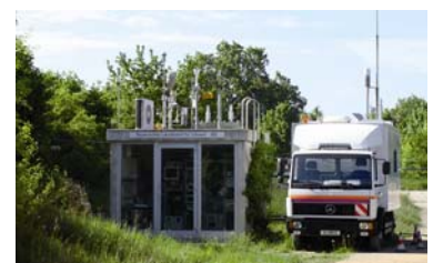
Mit der Station am LfU in Augsburg-Haunstetten wird laufend die Luftgüte gemessen.