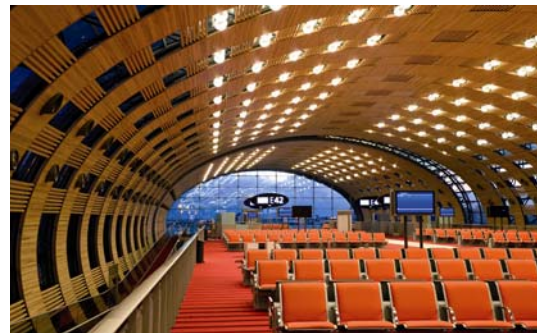
Das Holzdach im Pariser Flughafen Charles de Gaulle kommt aus dem Wirtschaftsraum Augsburg